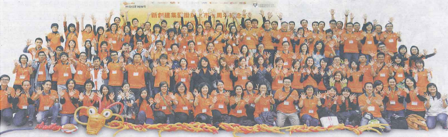
▲ 為慶祝掛牌上市10周年，新創建舉辦「創建社區關懷日2013」，逾百名義工走訪北區，探訪近200名區內長者，貫徹集團回饋社會的企業文化。