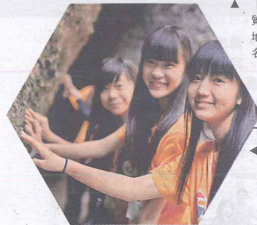
▲ 「青年地質保育大使」培訓計劃增進青年對地質保護的知識，好讓這個訊息能一代傳一代。